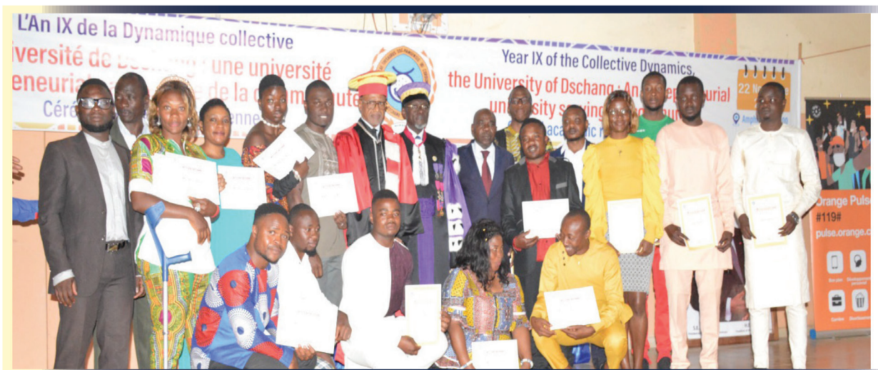
Les Lauréats du CATI 2 -UDs et le Top management de l'UDs

Dans le contexte de l'université entrepreneuriale, le CATI 2 -UDs représente le bras armé de l'UDs en ce sens qu'il permet le rapprochement entre théorie et pratique et fait cette institution le moule idéal pour jeunes entrepreneurs.