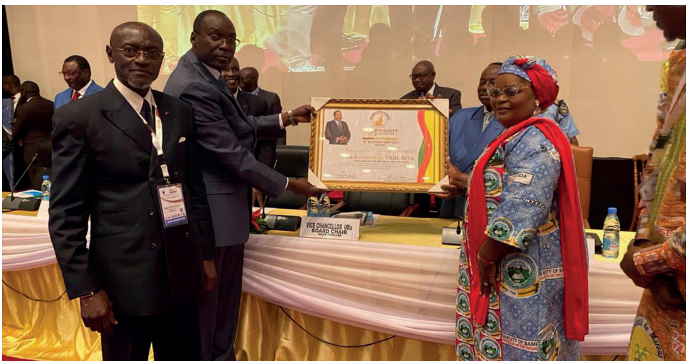
Remise du présent de SE Paul BIYA au MINETAT/MINESUP par les membres du RUFORUM

L'Assemblée Générale Annuelle du RUFORUM a été officiellement ouverte par le Professeur Jacques FAMA NDONGO, MINETAT /MINESUP, en présence de huit membres du gouvernement Camerounais et du MINETAT Tchadien.