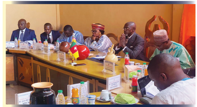
2 e session du CD de l'IBA

Au terme des travaux, le Recteur et sa suite ont saisi l'occasion de leur présence à Foumban pour aller féliciter le Sultan Nabil Mbombo Njoya pour l'inscription du « NGUON » sur la liste représentative du patrimoine immatériel de l'humanité.