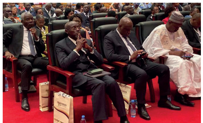
Le Recteur de l'UDs au RUFORUM 2023

Dschang does not intend to remain passive during the conference. It intends to contribute significantly to the success of the exchange session of this 19 th General Assembly of RUFORUM which is held at the Yaoundé conference center from October 28 th to November 2 nd , 2023. Five Cameroonian State universities are members of this institution: the University of Dschang, Bamenda, Buea, Maroua, and Ngaoundéré.