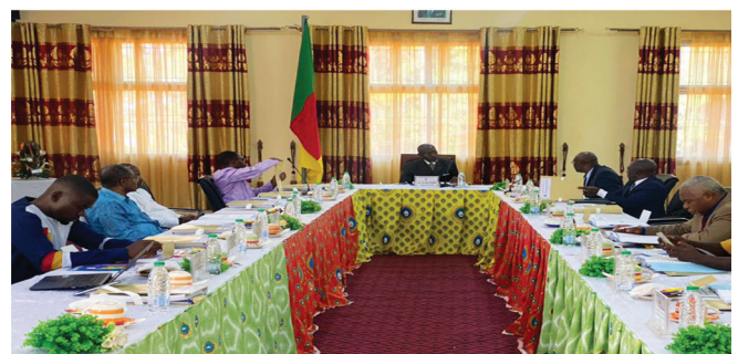
13 ème session du CD de l'IUT-FV

Des offres de formations qui devront être validées par le CU et le CA.