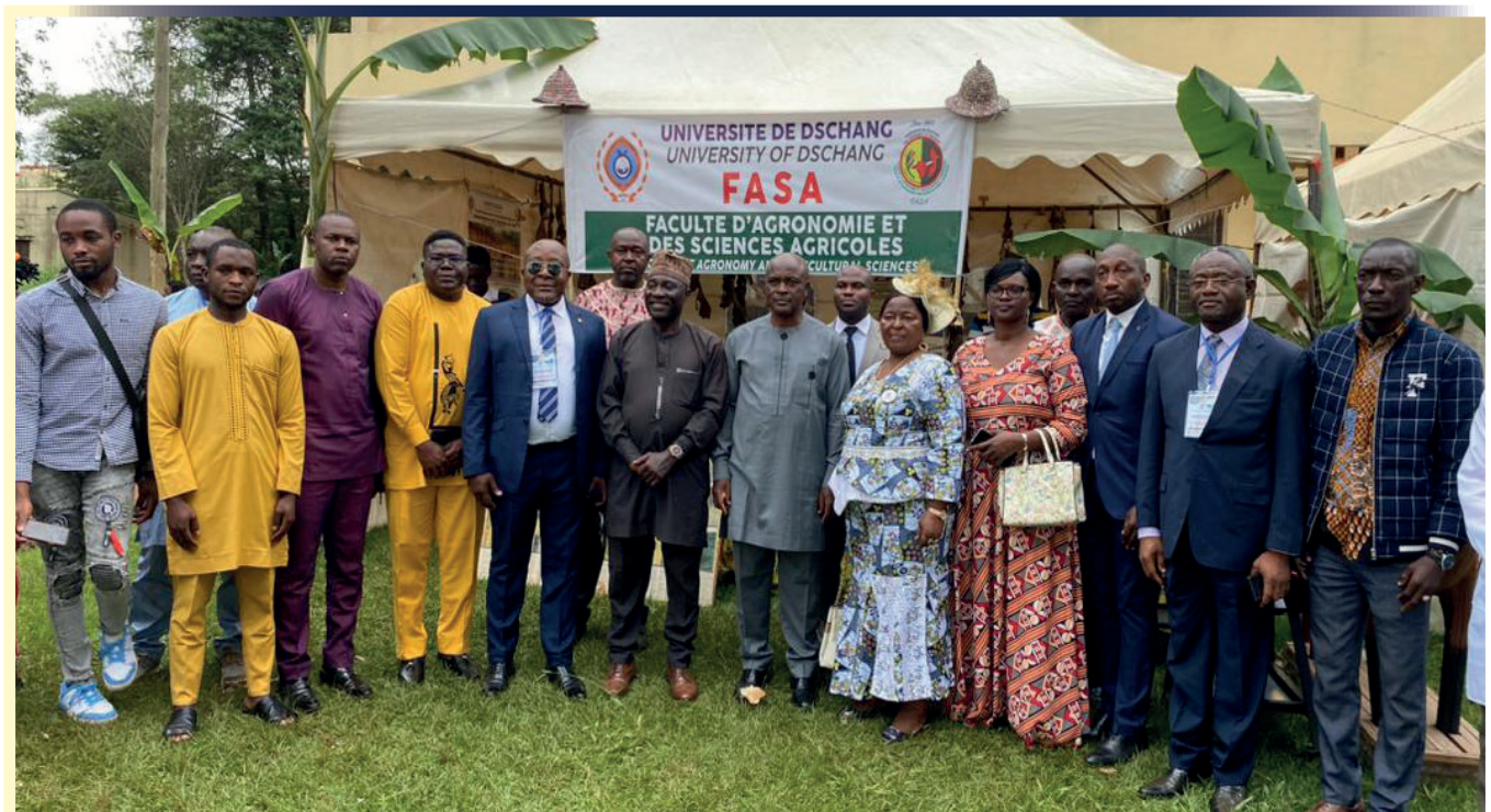
Photo de famille semaine Scientifique et Culturelle

Amuse-bouche, grillades, vins fabriqués par les étudiants-ingénieurs de la FASA étaient commercialisés. Les visiteurs y ont passé des moments d'échanges, de sensibilisation, d'apprentissage et d'éducation. Quelques volontaires des fan's clubs de l'IUT y mettaient de l'ambiance. Toutes ces manifestations se tiennent dans la mouvance et en prélude à la cérémonie officielle de rentrée académique imminente. Ce sera le 22 novembre prochain au Centre des conférences de l'Université de Dschang.