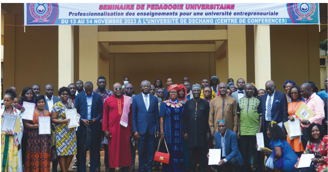
Photo de famille, séminaire de pédagogie universitaire

La table ronde sur le réarmement moral a souligné la responsabilité des enseignants chercheurs dans la construction d'une société apaisée, en mettant en avant les valeurs morales et l'éducation des apprenants.