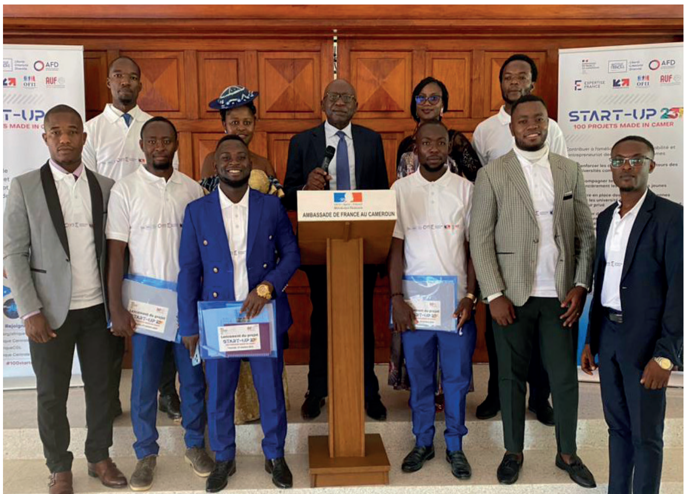
La team UD's à la residence de France à Yaoundé

au Cameroun, sur les 100 entreprises en compétition, 30 pourront bénéficier des financements. Pour cette édition, les secteurs retenus sont l'agroalimentaire, l'industrie culturelle et créative, le numérique. Au terme de la cérémonie d'ouverture solennelle présidé par le Professeur Jacques Fame Ndong, MINETAT/MINESUP, les jeunes entrepreneurs sont retournés à l'Institut Français du Cameroun pour la suite des travaux. « Start up 237 : 100 projets made in camer » est un projet porté par le Fonds Equipe France (FEF). Il vise à consolider l'employabilité et l'esprit l'entrepreneurial chez les jeunes des deux sexes au Cameroun ; accompagner techniquement et financièrement les initiatives des jeunes ; mettre en place des passerelles pérennes entre les universités camerounaises et le secteur privé, et d'apporter un appui financier aux startups privées afin qu'à travers leurs activités, elles deviennent des sources d'emploi pour les jeunes.