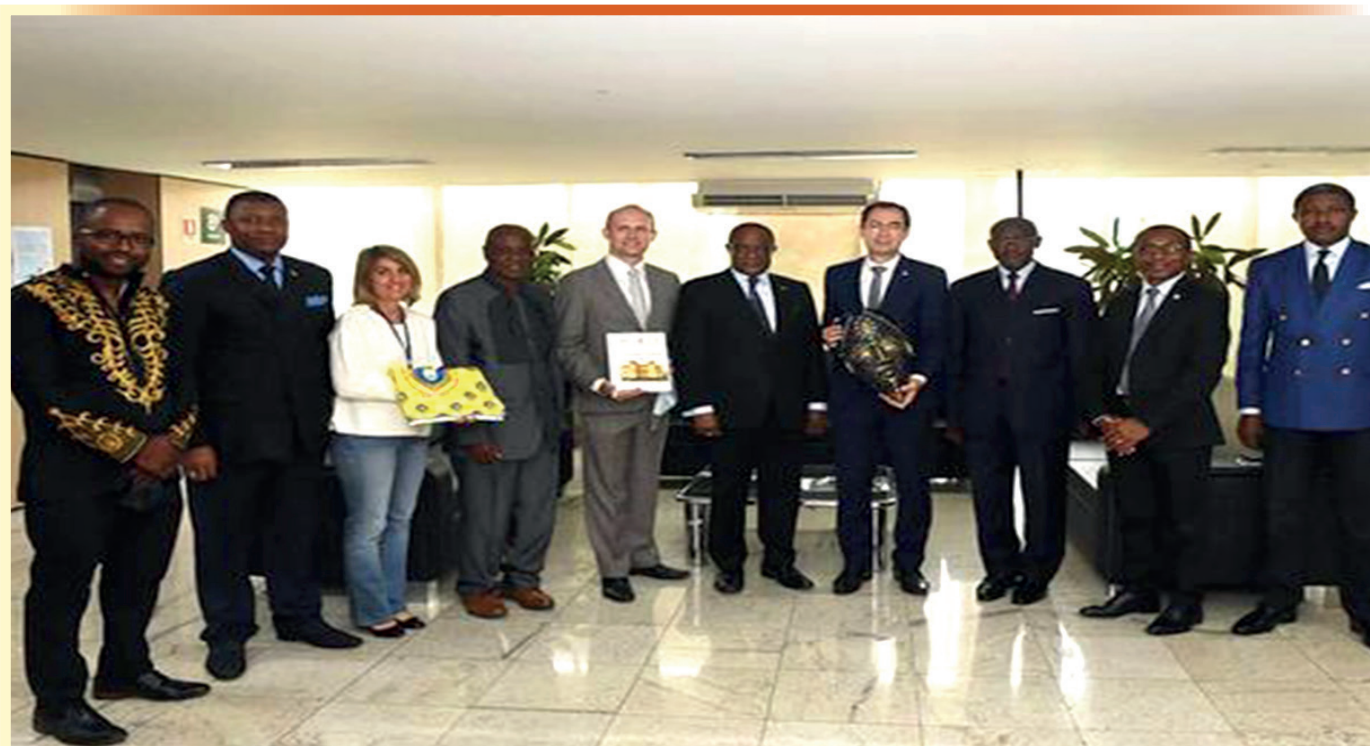
Délégation de l'UDs avec le Ministre de l'Éducation du Bresil

Para ; the implementation of the memorandum of understanding previously signed between the two universities. He wished to start with the Faculty of Science and the Faculty of Medicine of the University of Dschang, which seem to have main correspondents in the University of Para. The Minister and his deputy presented the higher education system in Brazil: 69 federal universities and 3000 private universities, with a total of 8.700.000 students. They noted that there were 53 Cameroonians in the Federal University for Integration of Lusophone Countries. The Minister was satisfied with the cooperation and clearly wished an extension to agronomy which many Brazilian universities excel in. His final suggestion to the University of Dschang was to select all Brazilian universities of interest and let him know so he would organize a visit to Dschang for a greater cooperation. The visit ended with the gift to the Minister by the Vice Chancellor.