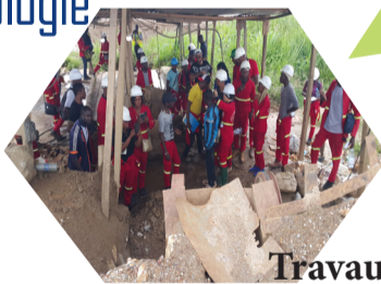
Travaux de terrain