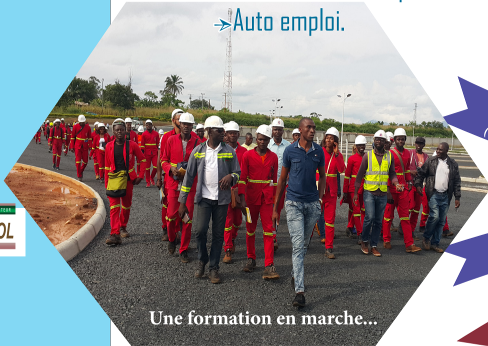
Une formation en marche...

100% insertion des étrangers dans leur pays