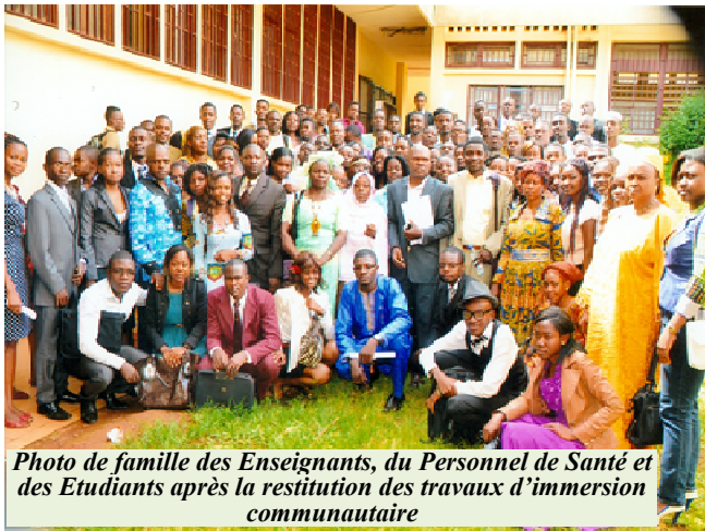
Photo de famille des Enseignants, du Personnel de Santé et des Etudiants après la restitution des travaux d'immersion communautaire