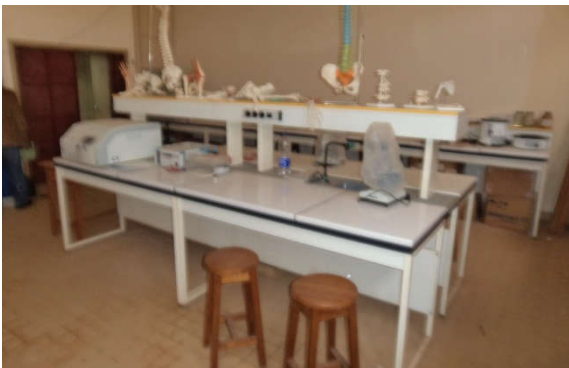
Une vue des équipements du laboratoire des Sciences Biomédicales