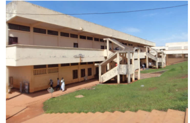
Une vue externe du bâtiment abritant les bureaux et les salles de classe de la Filière Sciences Biomédicales

FACULTE DES SCIENCES FACULTY OF SCIENCE Département des Sciences Biomédicales Department of Biomedical Sciences BP 67, Dschang (Cameroun) Tél./Fax (237) 243 691 512 E-mail : faculte_sciences@univ-dschang.org